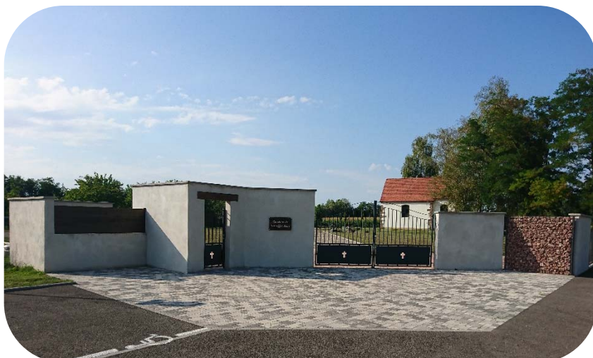
2016 : Nouveau cimetière 2017 : Embellissement de la Chapelle Saint-Blaise