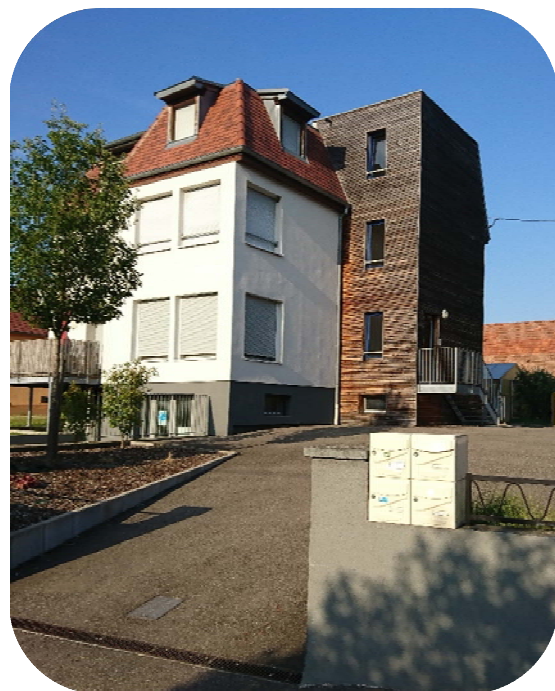
2012 Transformation du Presbytère en 3 logements