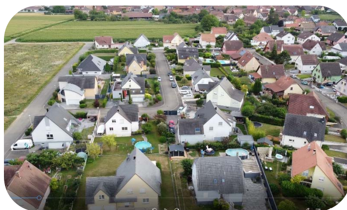
2004 5 ème tranche du lotissement de la Chênaie