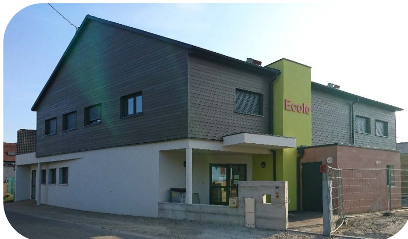
2017 Construction de la nouvelle école primaire