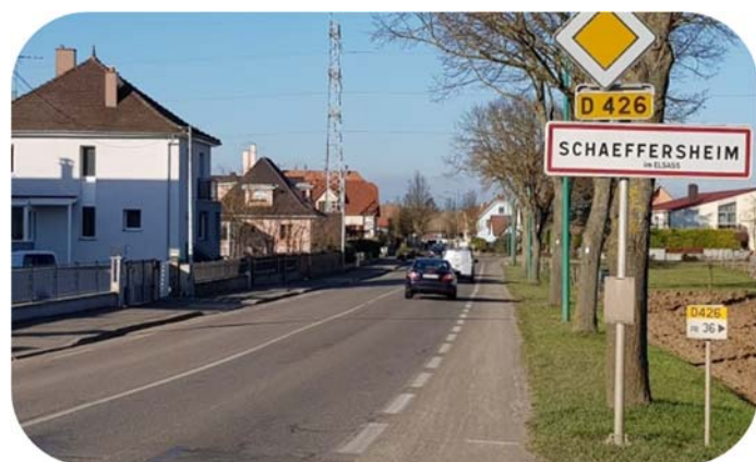
2002 et 2004 Réfection de la rue Principale

Nous avons tout de même souhaité en faire un récapitulatif succinct, afin de ne pas laisser sombrer dans l'oubli son empreinte sur notre village.