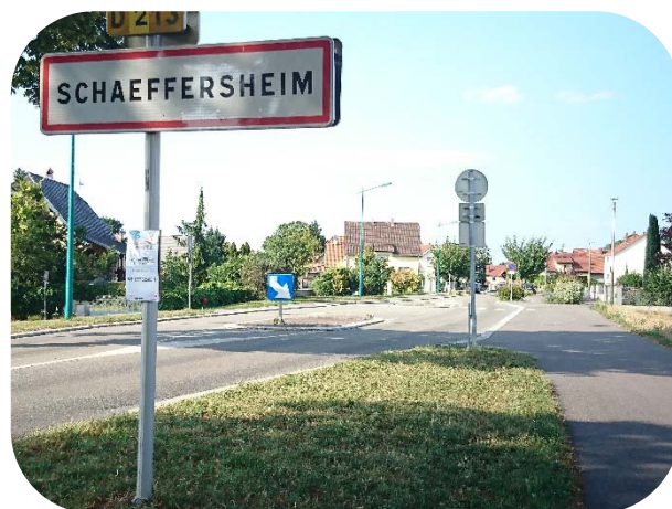
2009 Réfection de la rue de Bolsenheim