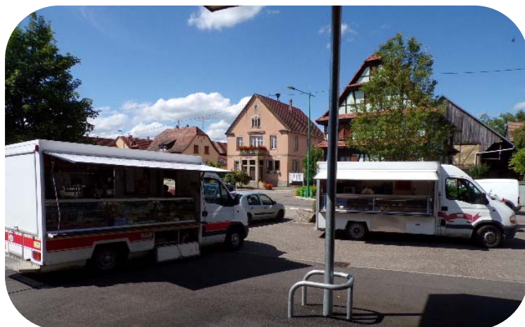
2007 Marché hebdomadaire