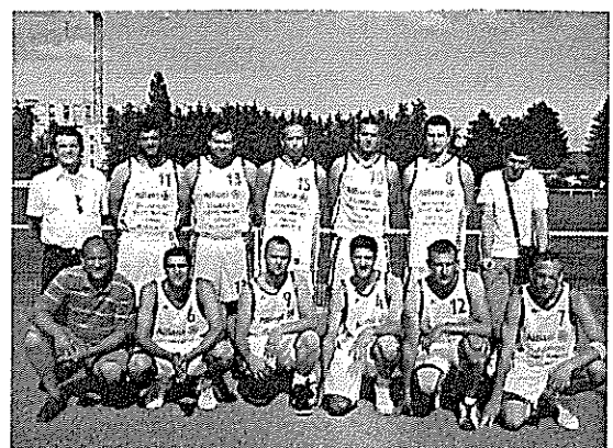
Seniors Masculins Champions du Bas-Rhin et d'Alsace 2011