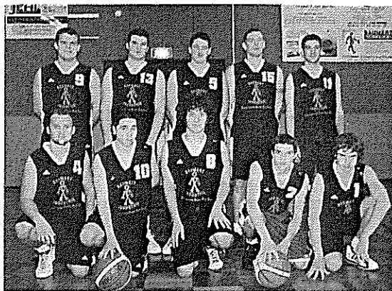
Juniors Masculins Champions du Bas-Rhin et d'Alsace 2011

Les minimes Féminines ont évolué en championnat régional et les résultats extraordinaires des équipes fanions motiveront nos jeunes basketteurs à suivre leurs pas.